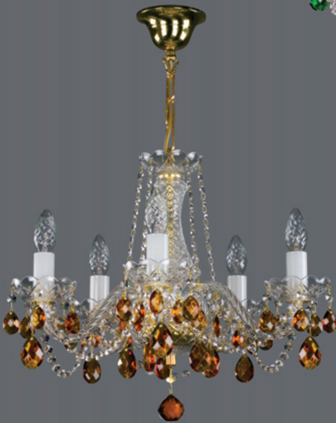
RADKA V. colour 510x450 mm 5x40 W