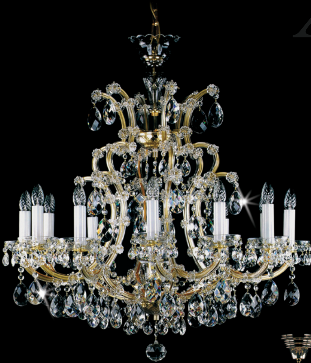
MARIA TEREZIA 12 800x900 mm 12x40 W + 1x60 W