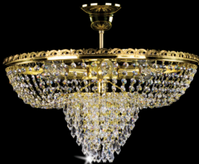
LUKRECIE 500x260 mm 7x40 W