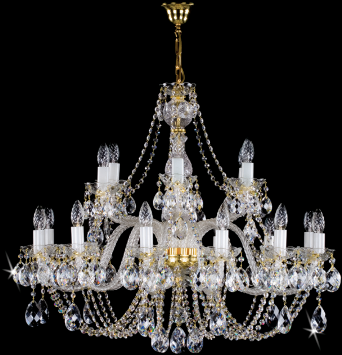
CHERRY 850x700 mm 18x40 W