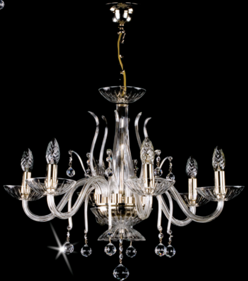
ELEKTRA VI. nickel 650x490 mm 6x40 W