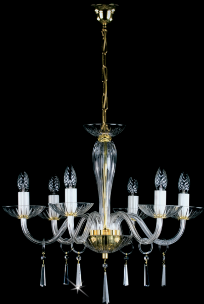
STEFANIE 600x550 mm 6x40 W