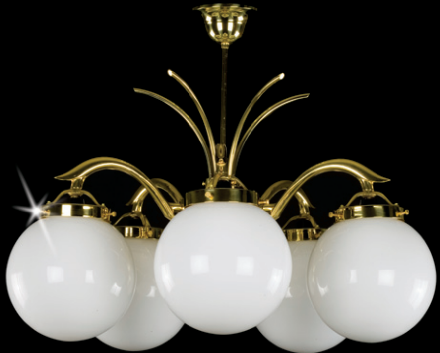
MICHAELA 680x550 mm 5x60 W