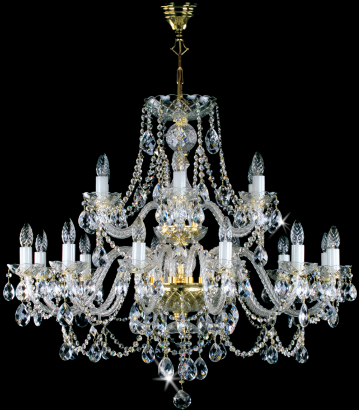
ANDREA XVIII. 950x750 mm 18x40 W