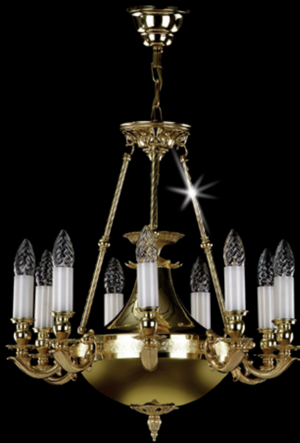
DAFNE 450x480 mm 9x40 W