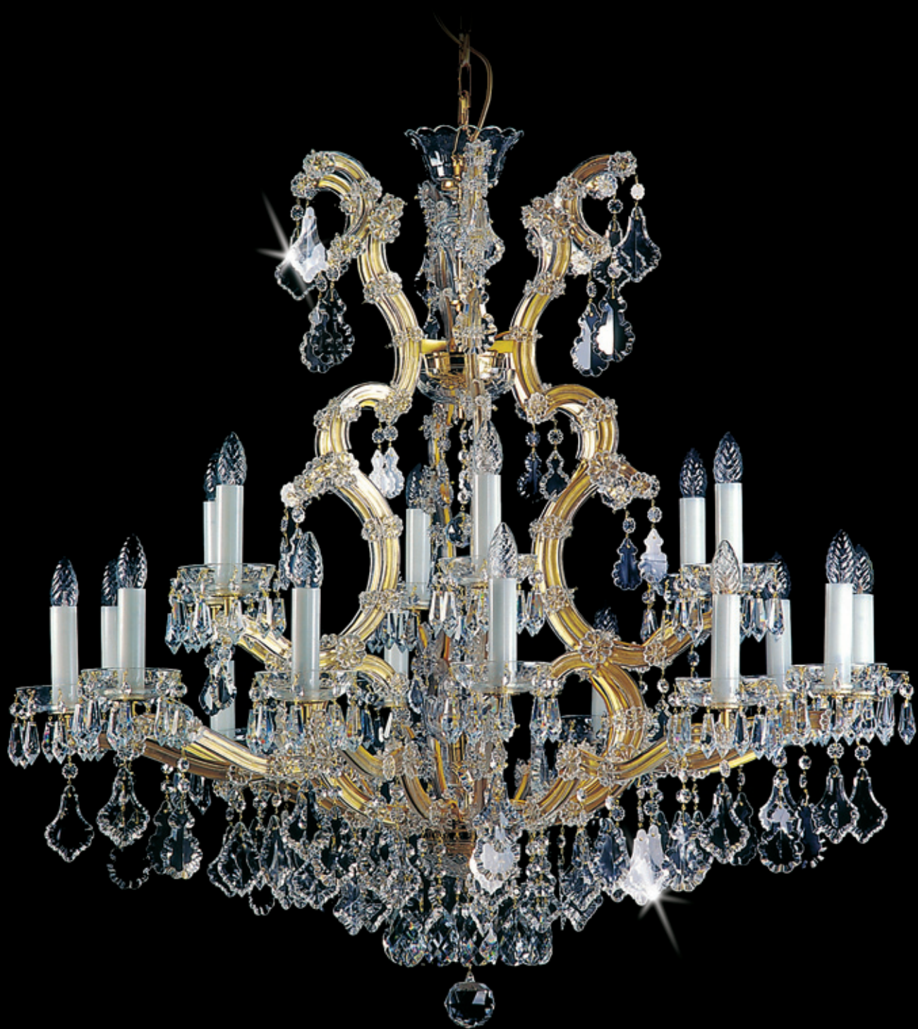
MARIA TEREZIA 5 1000x1100 mm 18x40 W + 1x60 W