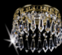
SPOT 03 120x75 mm 1x35 W