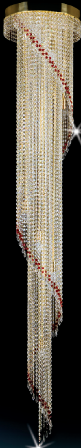
SPIRAL dia. 400 400x2300 mm 12x40 W