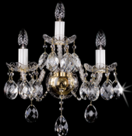
TIBORA III. WL 340x340 mm 3x40 W