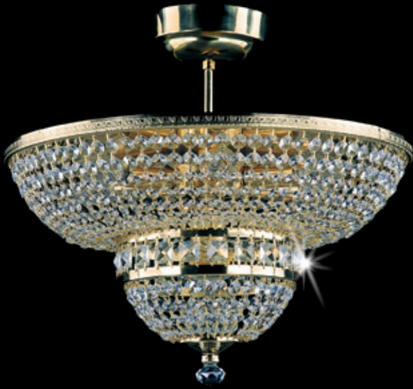
MARIE 450x400 mm 7x40 W