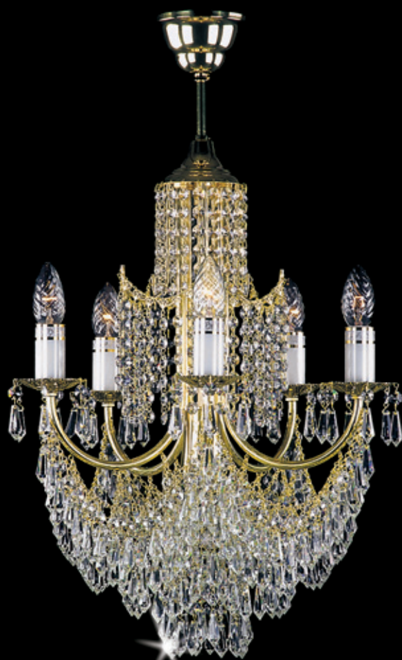
GITA 450x600 mm 5x40 W + 1x60 W