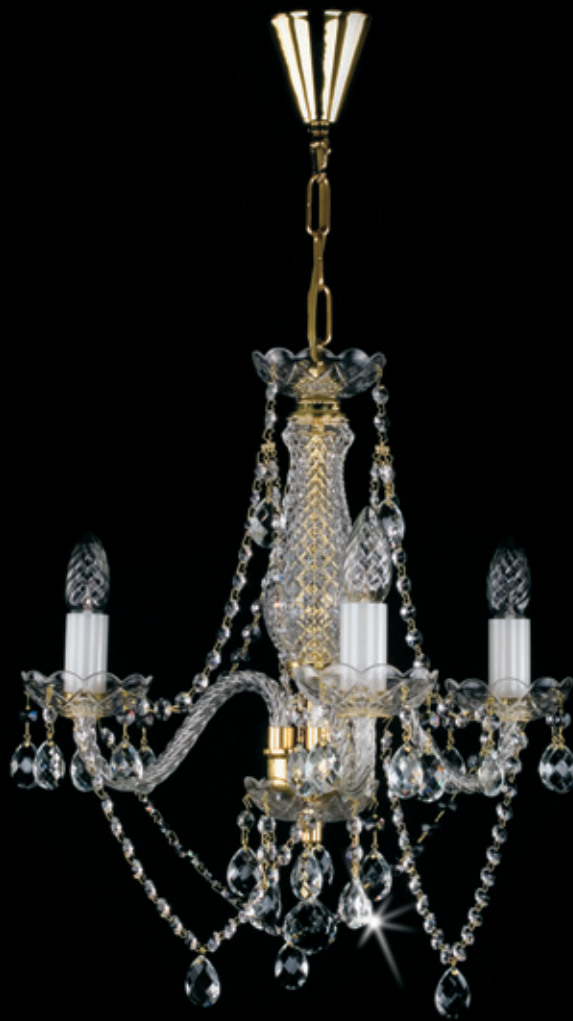
MAGDA III. 480X420 mm 3X40 W