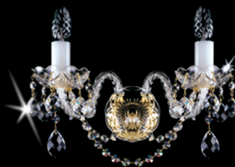
MIRKA II. WL 340x250 mm 2x40 W