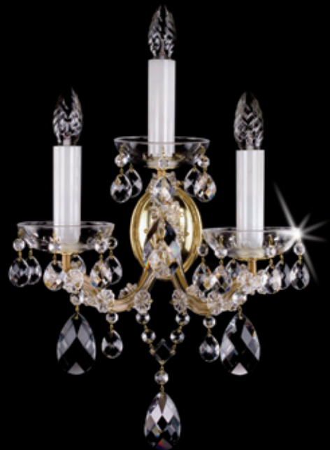
MARIA TEREZIA 18 WL 330x400 mm 3x40 W