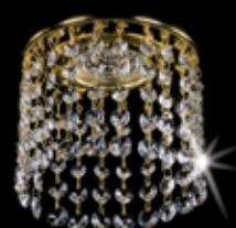
SPOT 09 120x95 mm 1x35 W