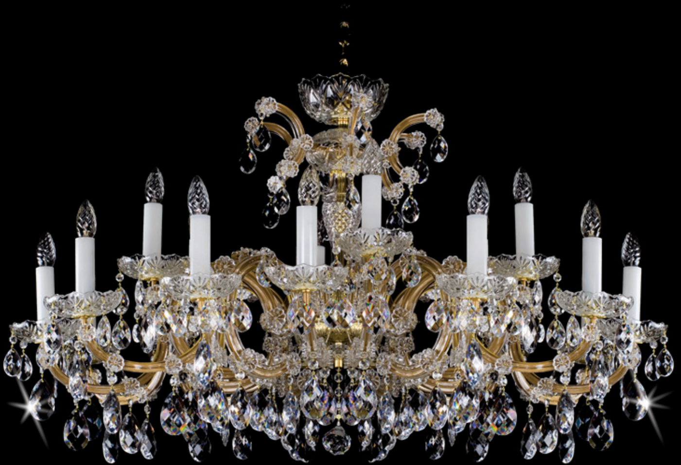
MARIA TEREZIA 17 1120x660 mm 18x40 W