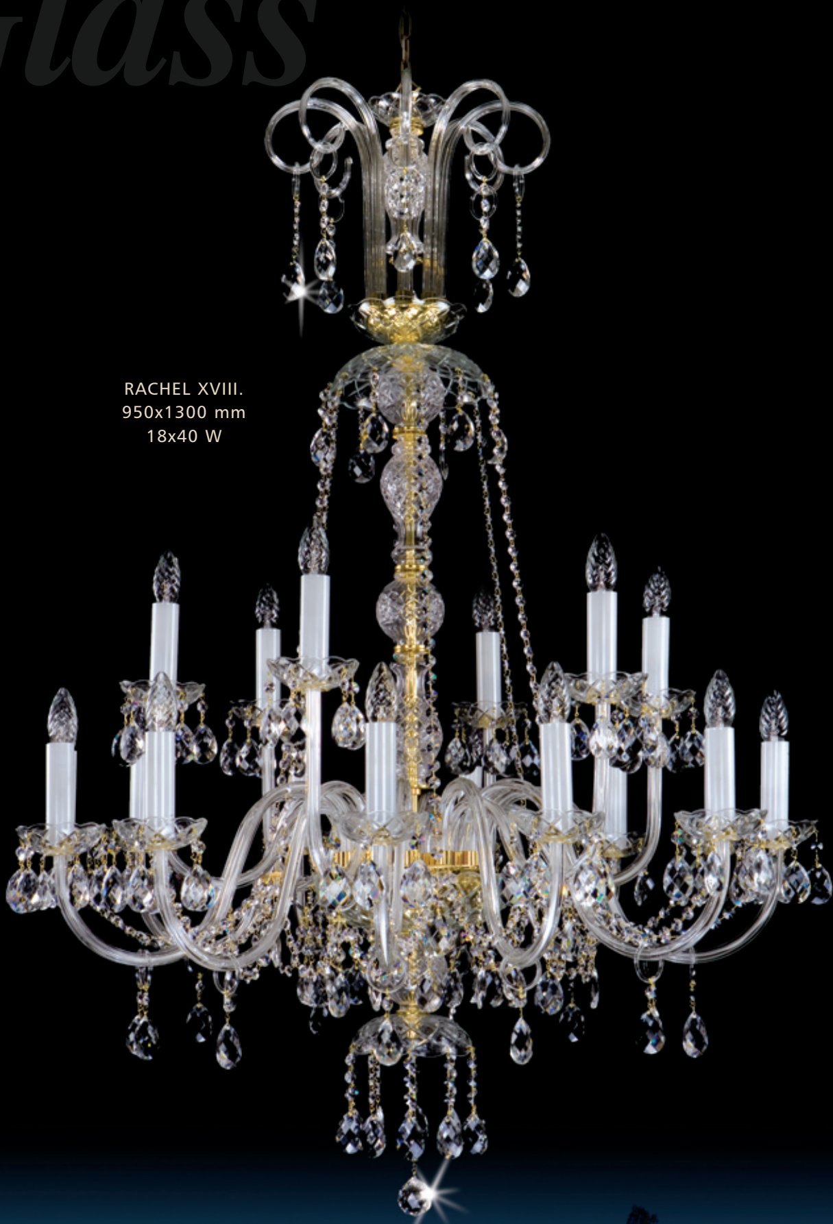
RACHEL XVIII. 950x1300 mm 18x40 W