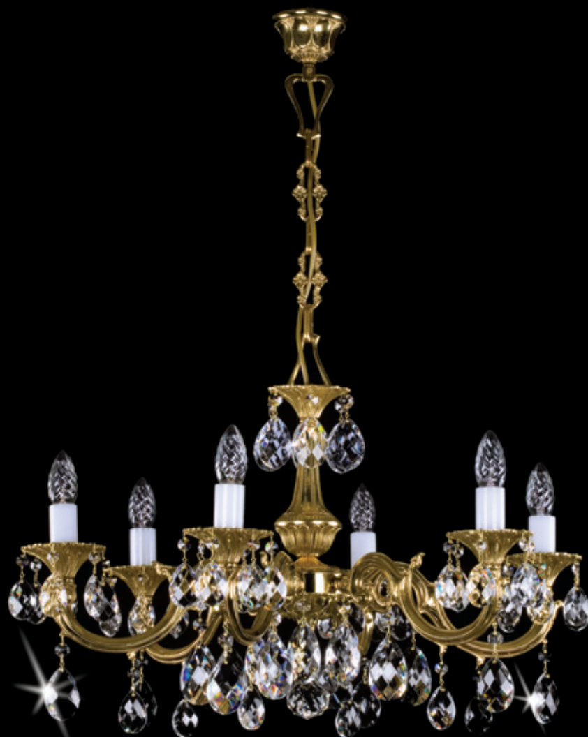
ALICE VI. 670x410 mm 6x40 W