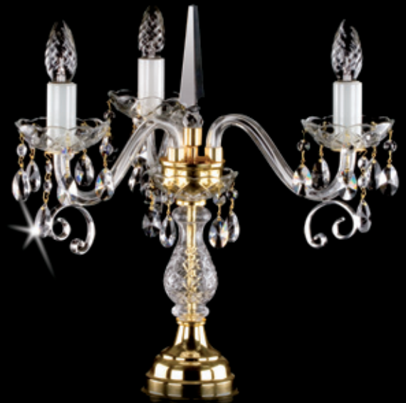
AUGUSTINA III. TL 400x450 mm 3x40 W