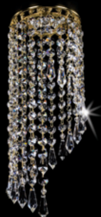
SPOT 06 120x340 mm 1x35 W