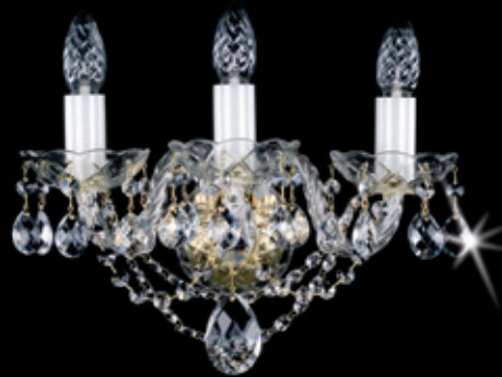
MARION III. WL 330x330 mm 3x40 W