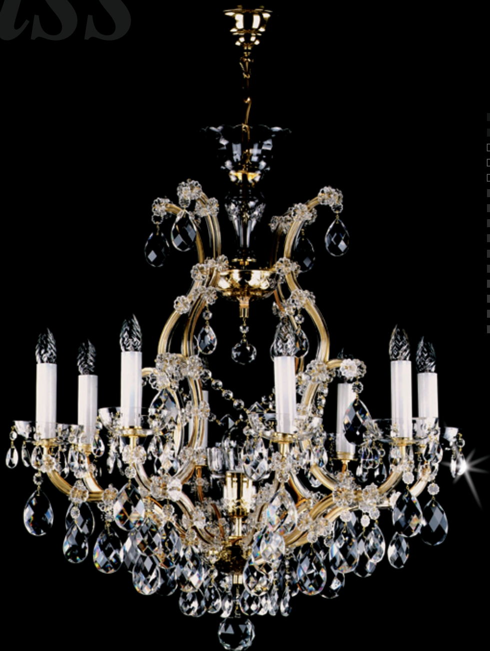
MARIA TEREZIA 11 730x790 mm 8x40 W + 1x60 W