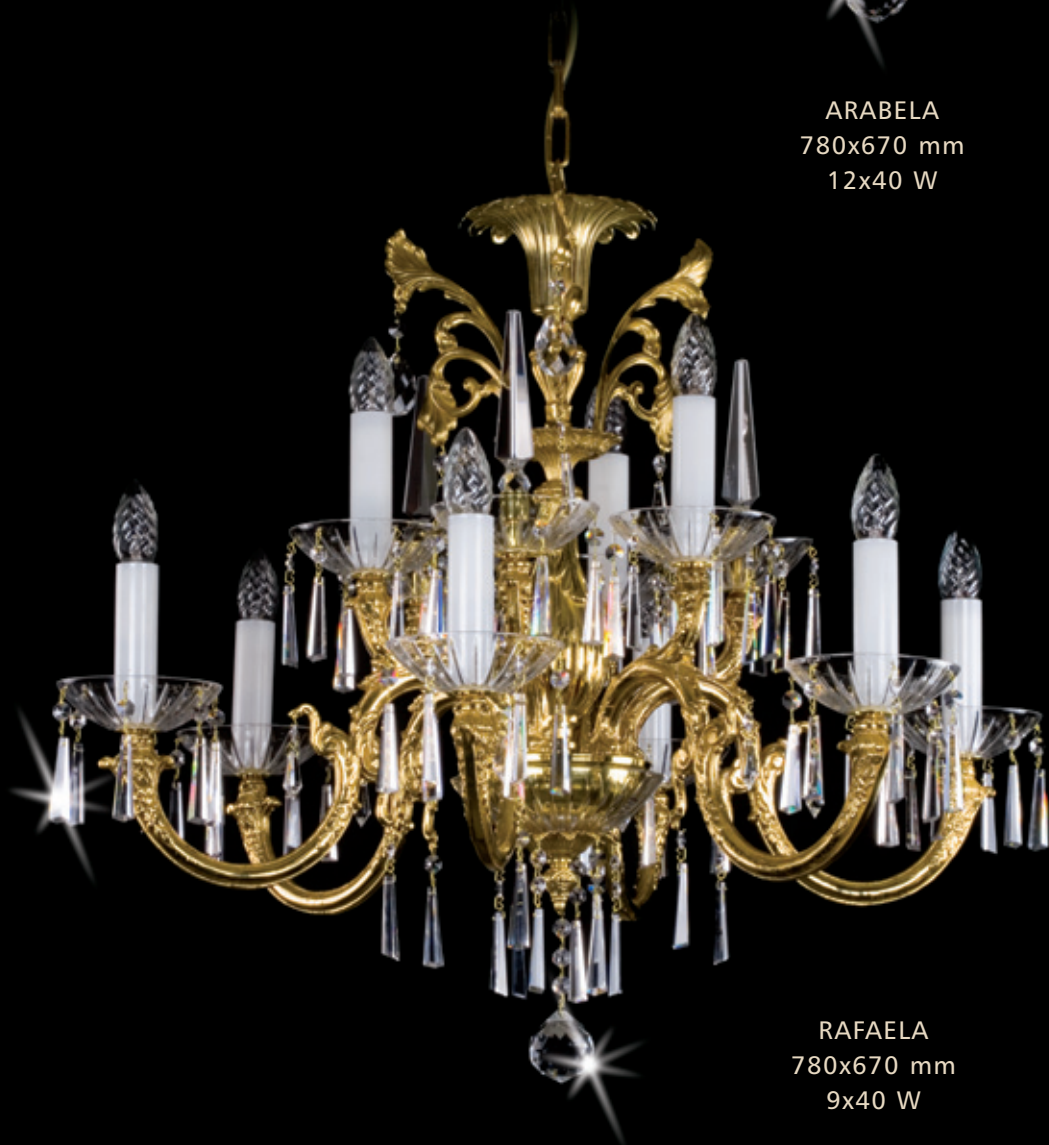
RAFAELA 780x670 mm 9x40 W