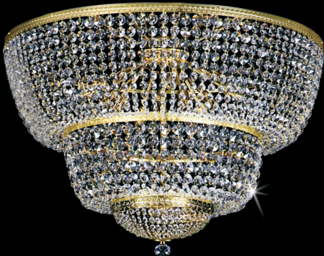
FRIDA 800x550 mm 10x40 W