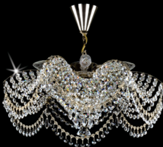
PAVLA I. nickel 460x340 mm 6x40 W