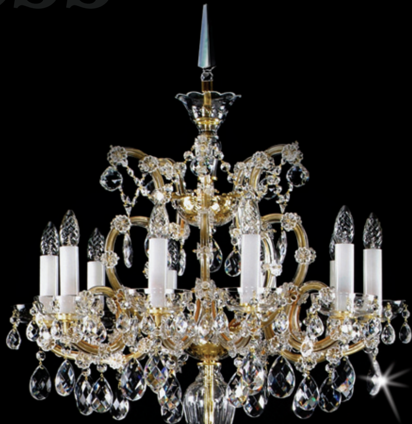
MARIA TEREZIA 16 TL 680x1680 mm 10x40 W