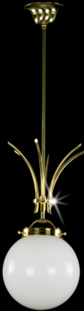
MELISA 200x900 mm 1x60 W