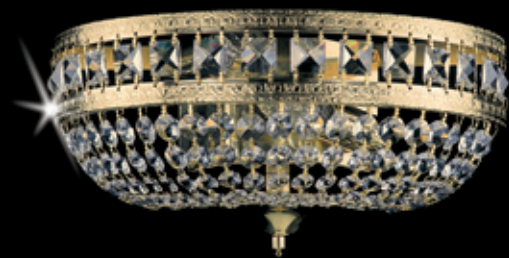
IVONA WL 300x150 mm 2x40 W