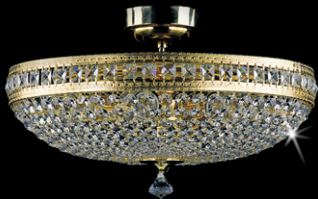
MILADA II. 500x280 mm 6x40 W