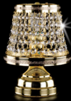
KLOTYLDA TL 150x200 mm 1x40 W