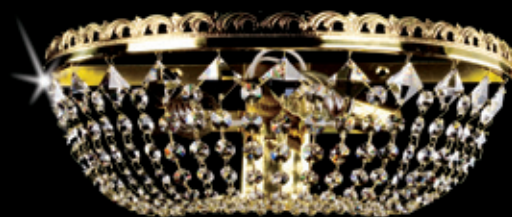
PERLA WL 360x115 mm 2x40 W