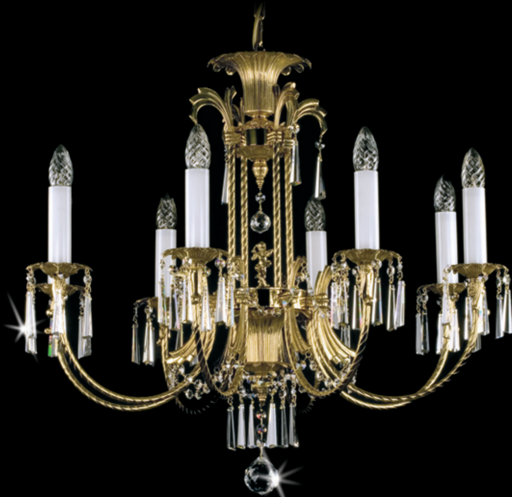
CELESTINA 740x640 mm 8x40 W