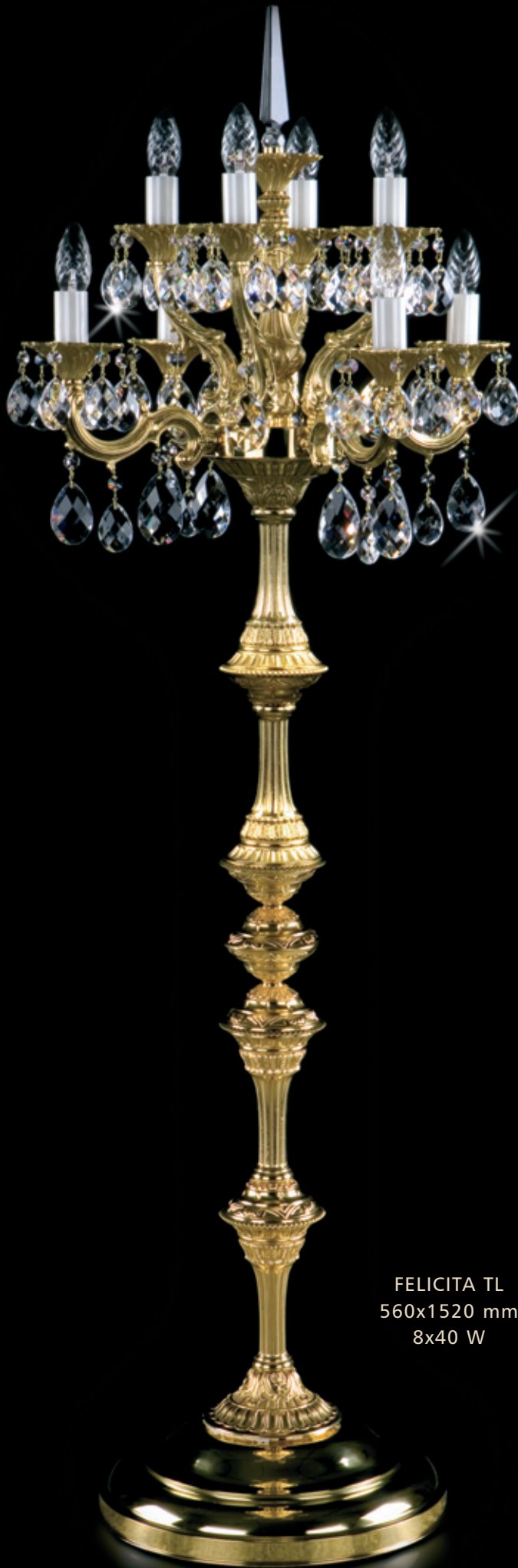
FELICITA TL 560x1520 mm 8x40 W