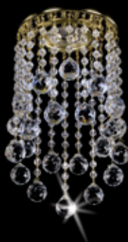
SPOT 05 120x205 mm 1x35 W