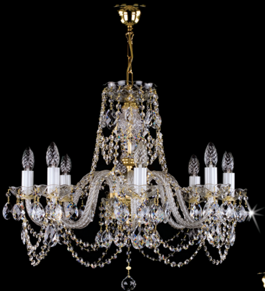
DONATELA 670x600 mm 8x40 W