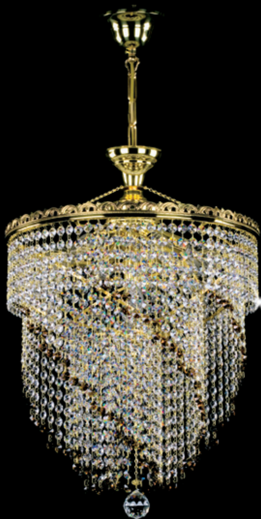
JASMINA 400x580 mm 7x40 W