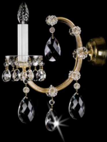
MARIA TEREZIA 10 WL 115x340 mm 1x40 W