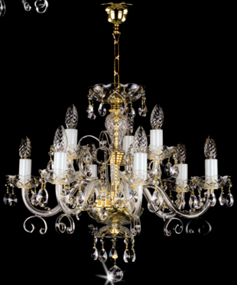
ELIZABETHA IX. 600x480 mm 9x40 W