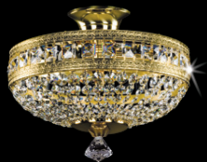
MILADA dia. 300 300x170 mm 3x40 W