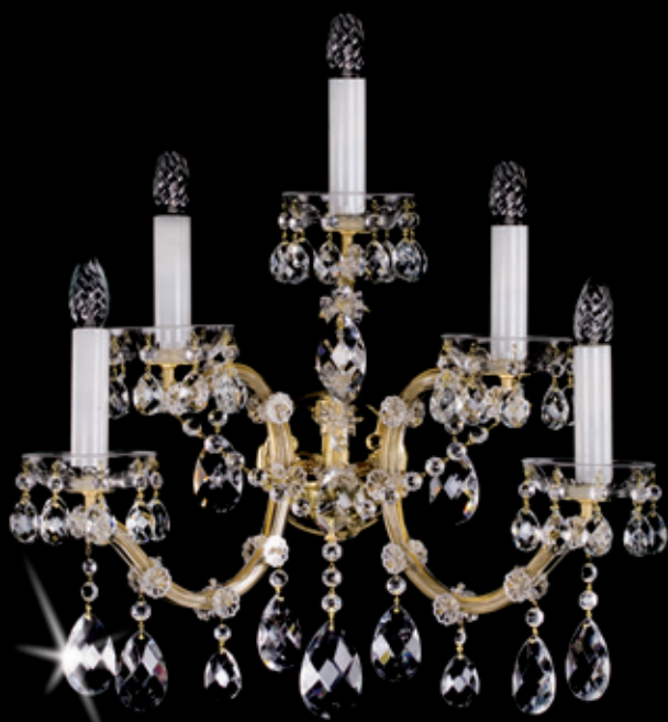
MARIA TEREZIA 8 WL 450x500 mm 5x40 W