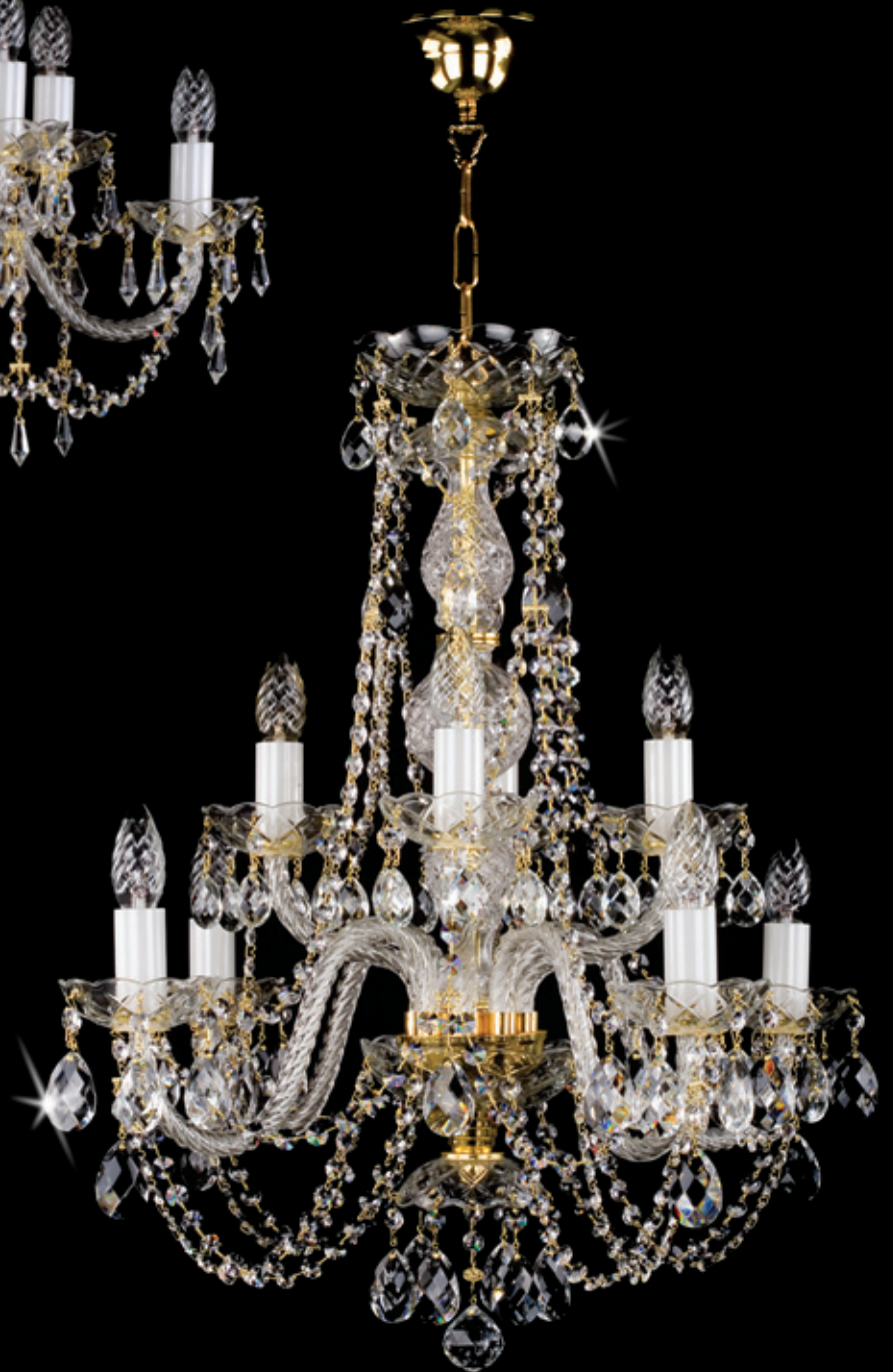
MARGITA 650x680 mm 8x40 W