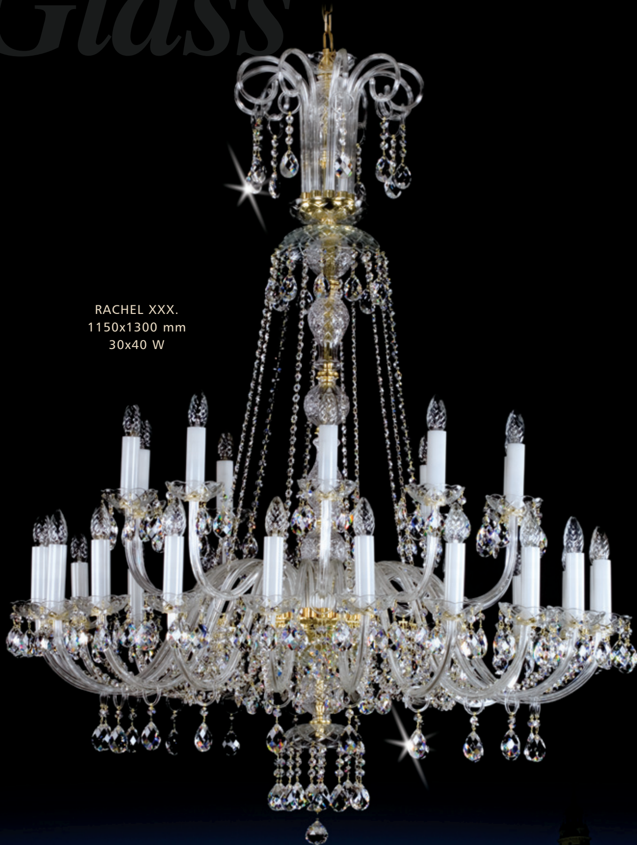
RACHEL XXX. 1150x1300 mm 30x40 W