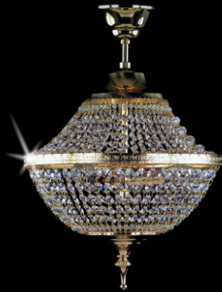
MARINA I. 300x370 mm 3x40 W