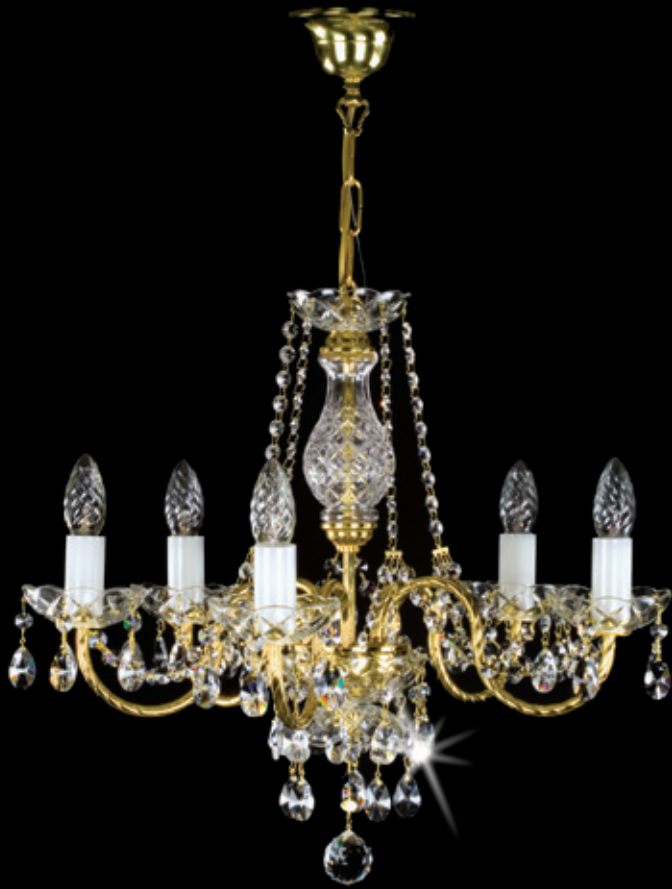
ADELA V. 530x480 mm 5x40 W