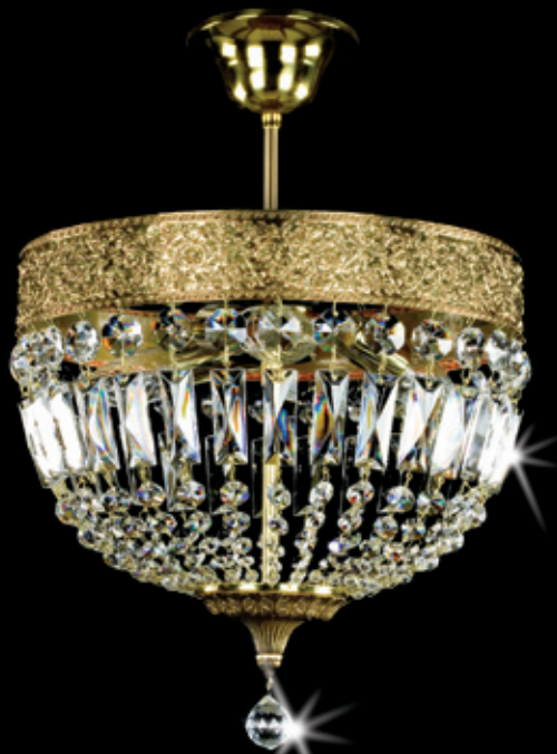
BABETA I. 310x300 mm 3x40 W