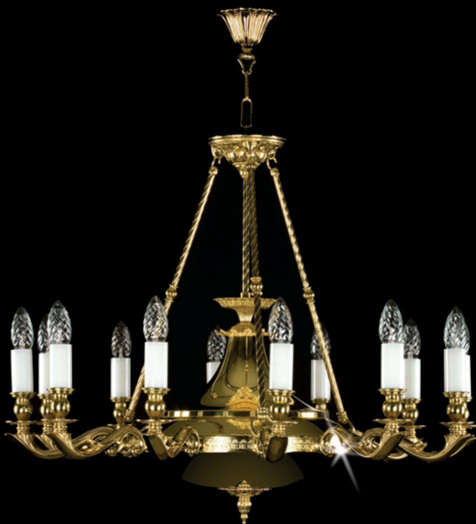
GERALDINA 720x580 mm 12x40 W