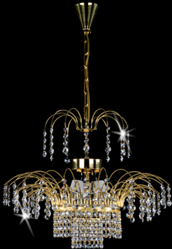
VESNA 520x410 mm 3x60 W