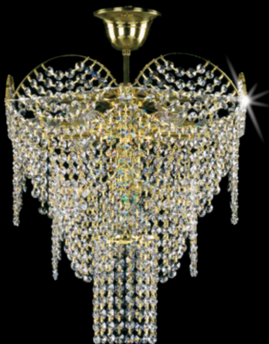
ROXANA 410x500 mm 6x40 W + 1x60W