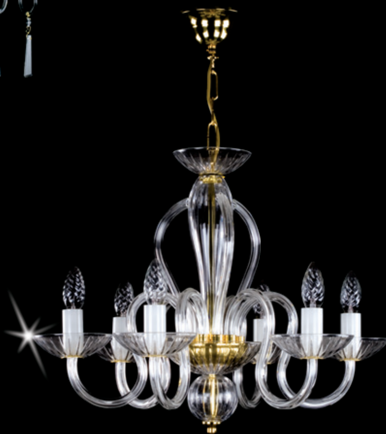
HANNAH 560x440 mm 6x40 W