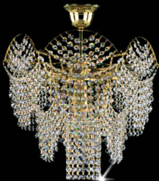
HELENA I. 400x360 mm 6x40 W + 1x60 W