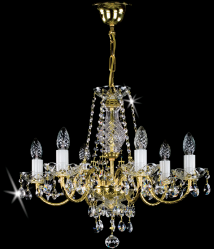
ADELA VI. 530x480 mm 6x40 W