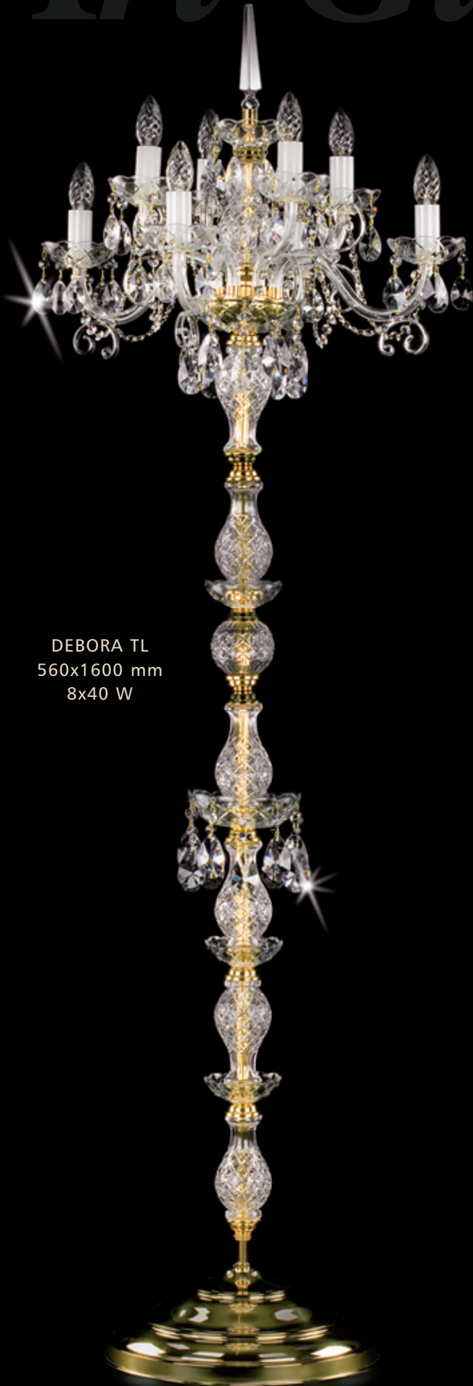
DEBORA TL 560x1600 mm 8x40 W