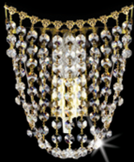
HORTENSIE WL 170x170 mm 1x40 W