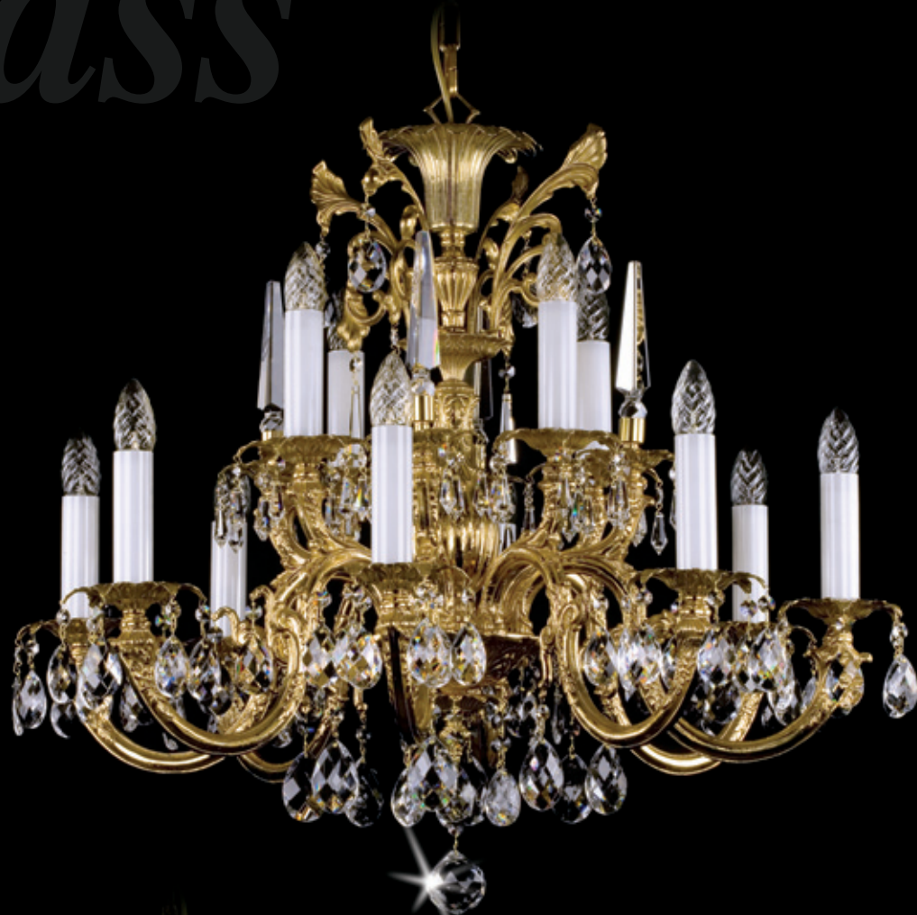
ARABELA 780x670 mm 12x40 W