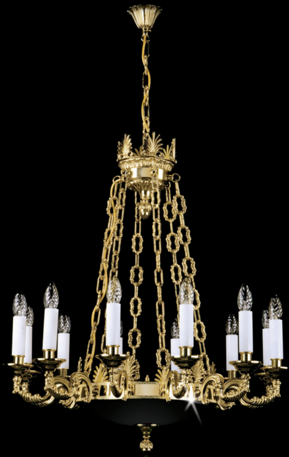
EGONA 730x800 mm 12x40 W