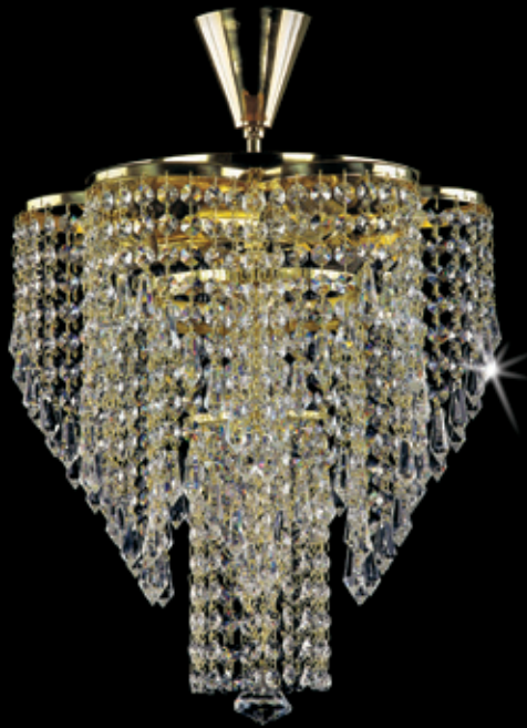
MARCELA 350x400 mm 3x40 W + 1x60 W