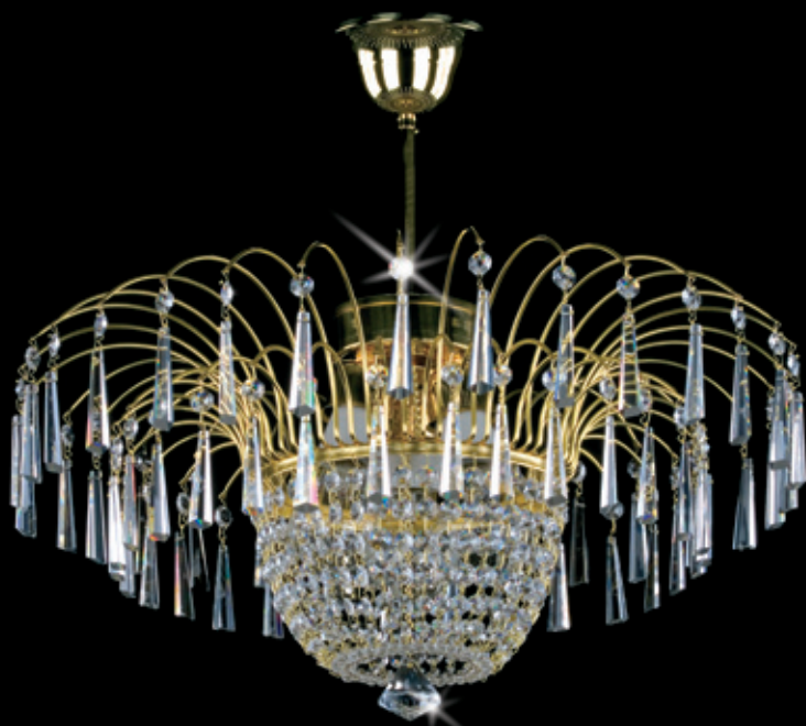
AMALIE II. 550x300 mm 3x60 W