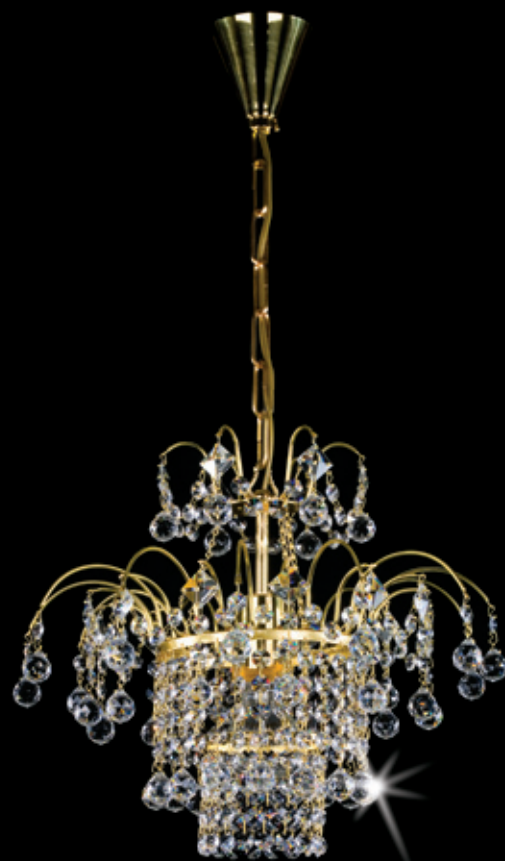
ODETA 380x330 mm 1x60 W