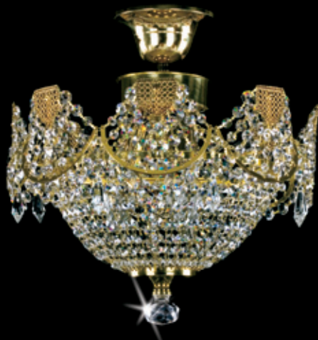
IRENA II. 350x350 mm 3x40 W