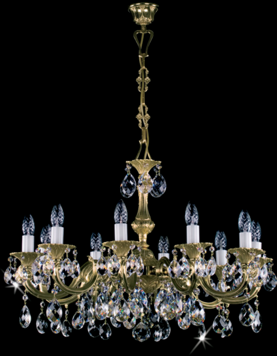
ALICE X. 720x500 mm 10x40 W