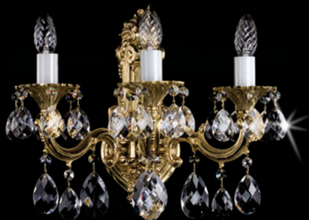
ŠÁRKA III. WL 400x340 mm 3x40 W