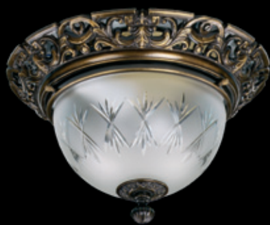
LEA I. 300x190 mm 1x60 W