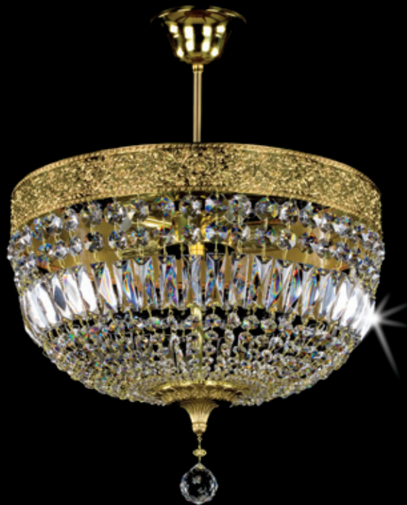
BABETA II. 420x350 mm 6x40 W