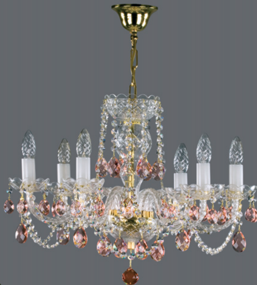
TAĚÁNA colour 600x480 mm 6x40 W