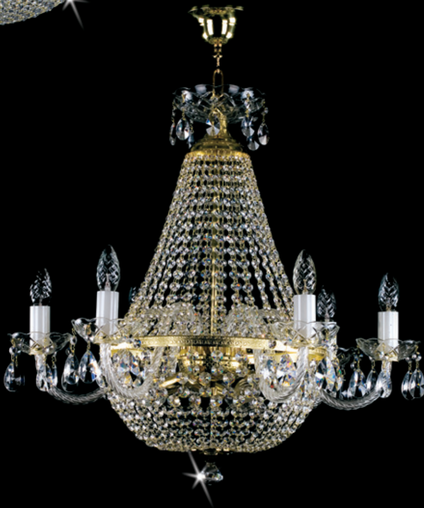
DOLORES 650x620 mm 9x40 W