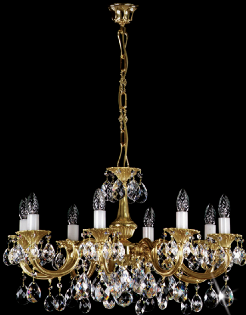
ALICE VIII. 670x410 mm 8x40 W