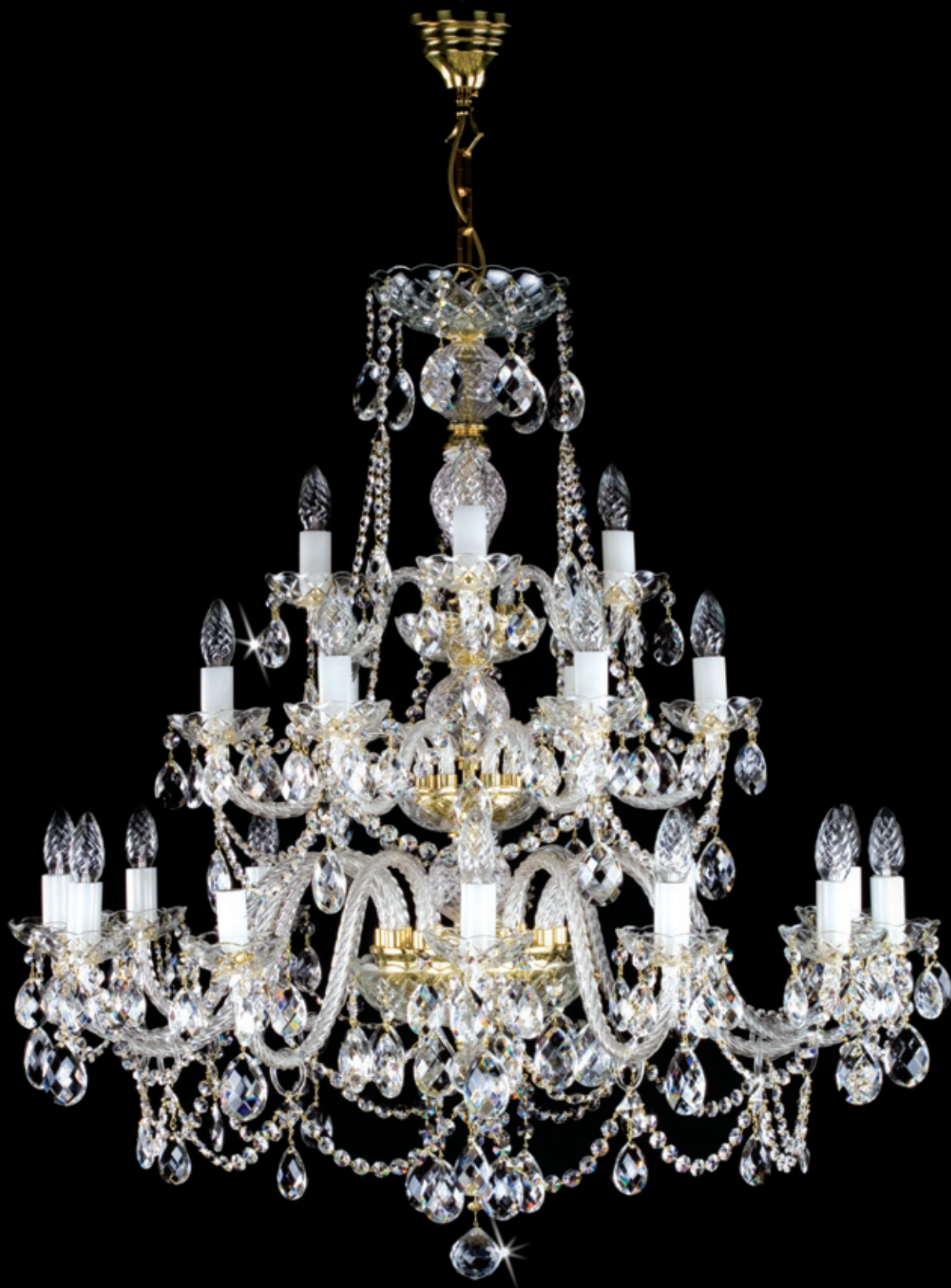
ANDREA XXI. 950x960 mm 21x40 W