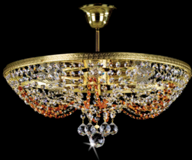
LARISA 500x200 mm 6x40 W