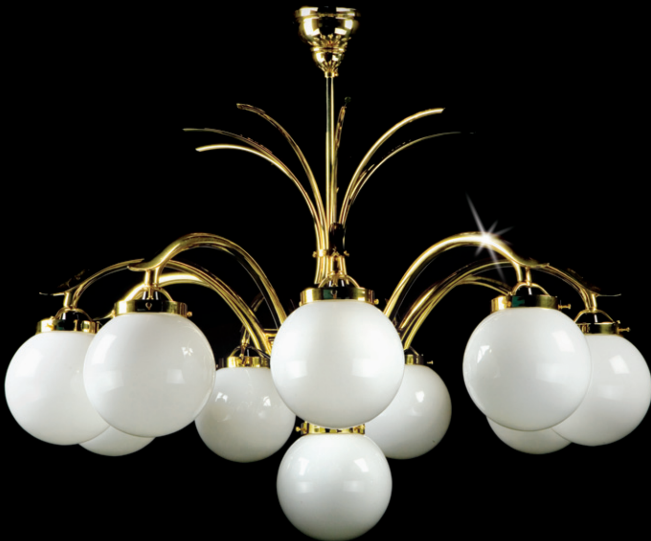
SYBILA 1100x880 mm 10x60 W