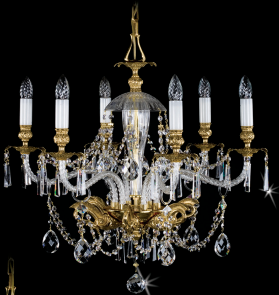
LUISA 720x600 mm 6x40 W