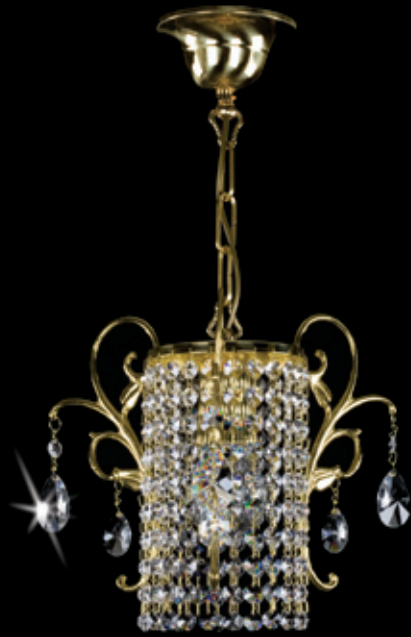
MARTINA 300x370 mm 1x60 W