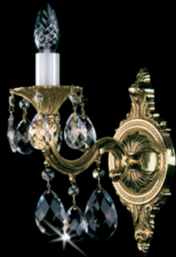
ŠÁRKA I. WL 110x360 mm 1x40 W