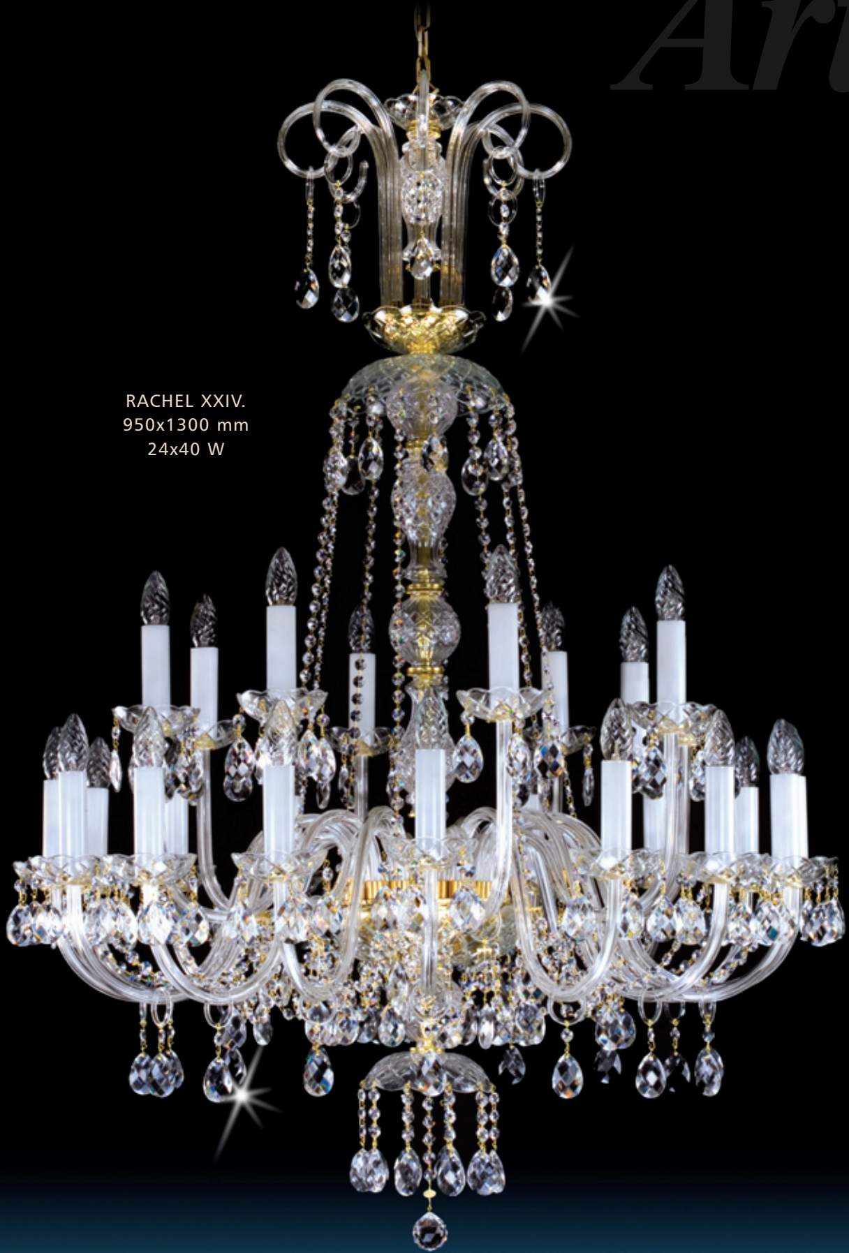
RACHEL XXIV. 950x1300 mm 24x40 W