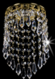
SPOT 04 120x170 mm 1x35 W