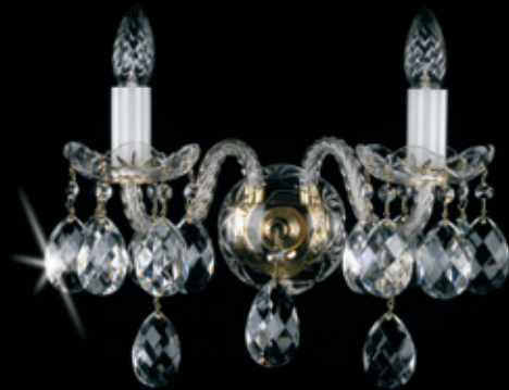
TIBORA II. WL 340x250 mm 2x40 W