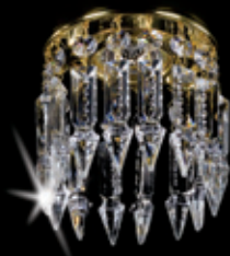
SPOT 01 120x115 mm 1x35 W