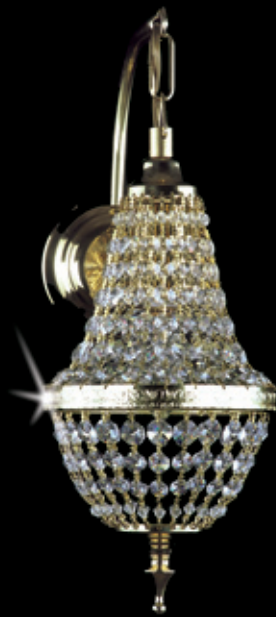
IVETA WL 150x400 mm 1x60 W