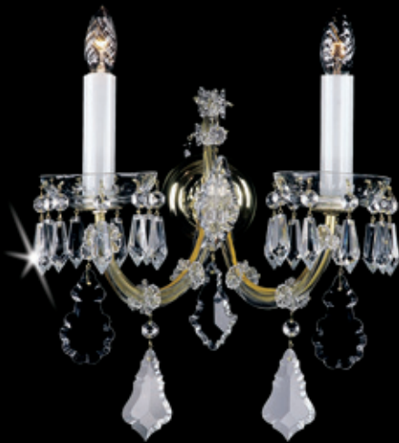
MARIA TEREZIA 9 WL 330x350 mm 2x40 W