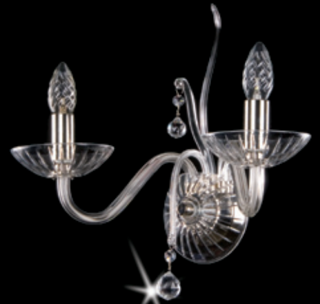
GARMINA II. WL nickel 400x360 mm 2x40 W