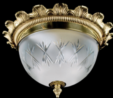
LEA II. 370x230 mm 2x60 W