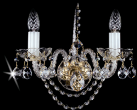
MARION II. WL 330x280 mm 2x40 W