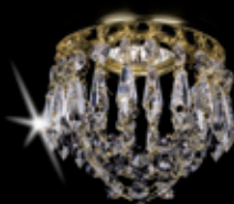
SPOT 07 120x110 mm 1x35 W