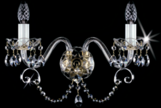
MATYLDA II. WL 370x250 mm 2x40 W