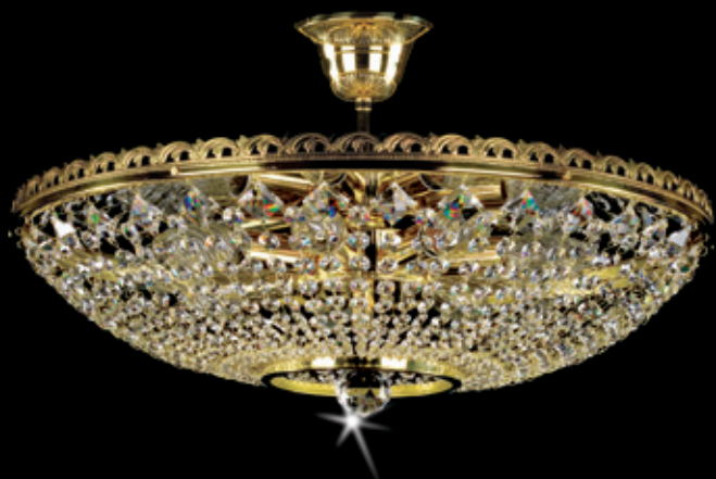
NORMA III. + mirror NORMA III. 500x160 mm 8x40 W