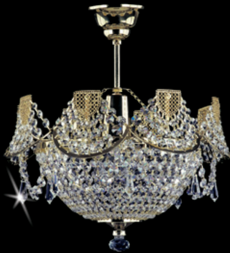
IRENA 350x350 mm 1x60 W