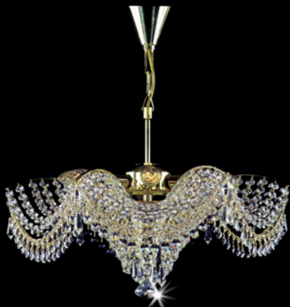
PAVLA I. 460x340 mm 6x40 W