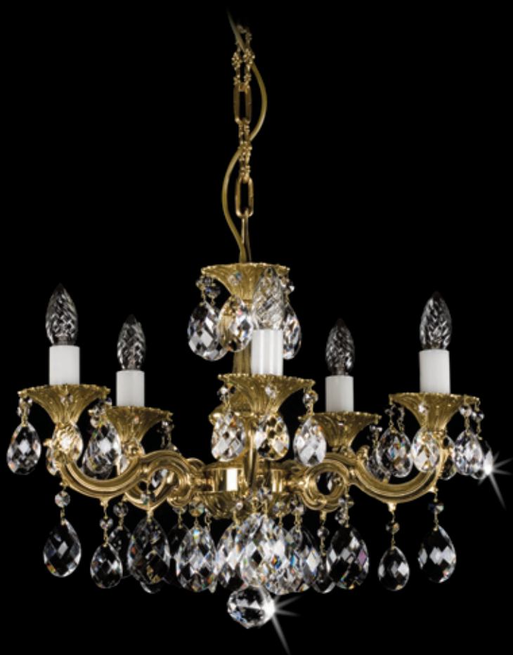
JARMILA 520x350 mm 5x40 W