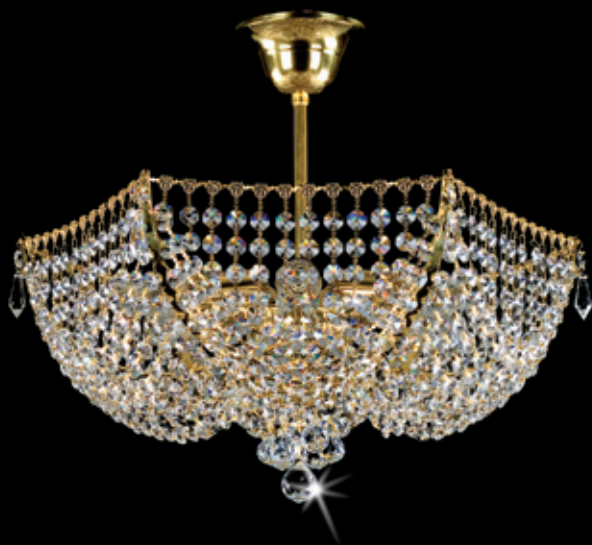
PRISCILA 450x200 mm 6x40 W