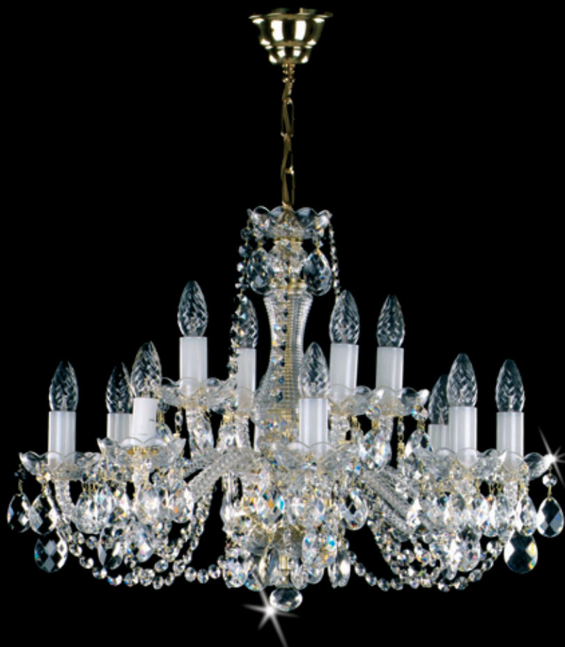
CARMEN 620x480 mm 12x40 W