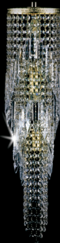
KAMILA WL 150x700 mm 3x40 W