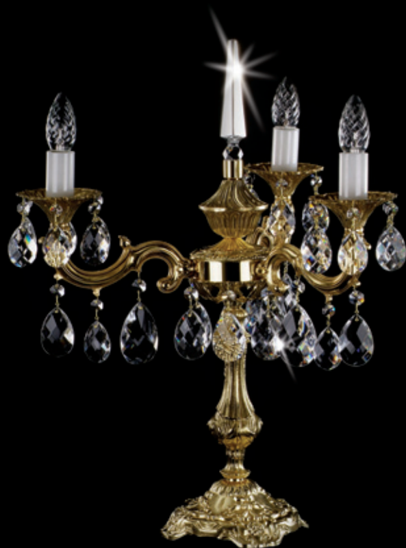
SOŇA III. TL 520x570 mm 3x40 W