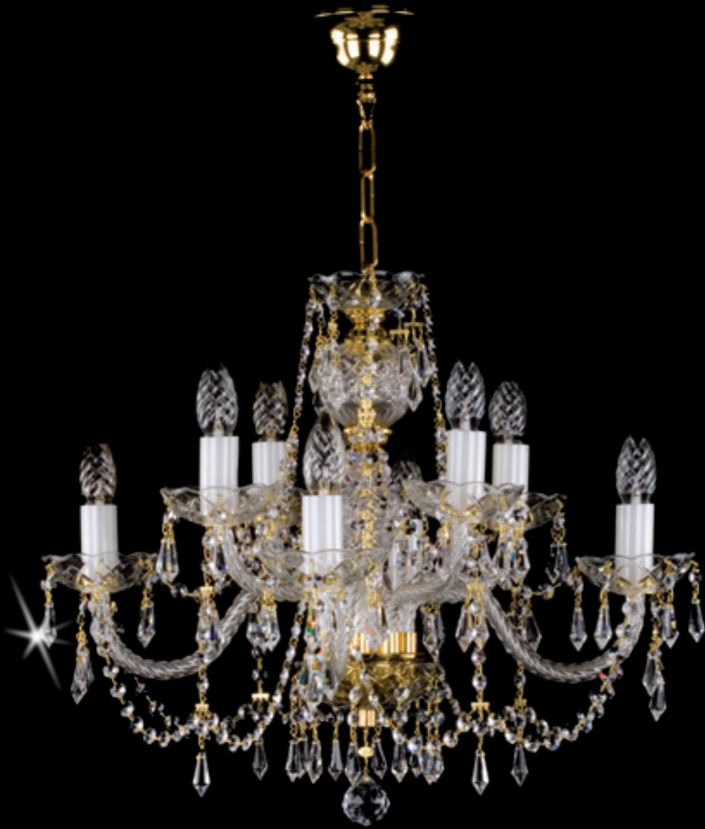
BRIGITA 580x480 mm 8x40 W