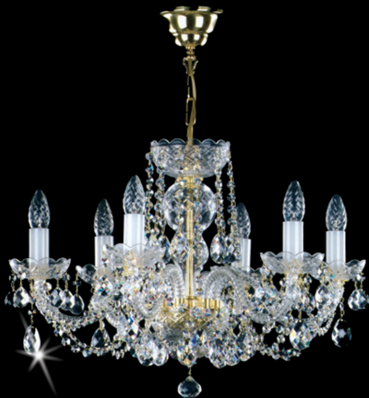
TAĚÁNA 600x480 mm 6x40 W