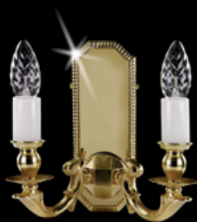
GRACIE II. WL 210x200 mm 2x40 W