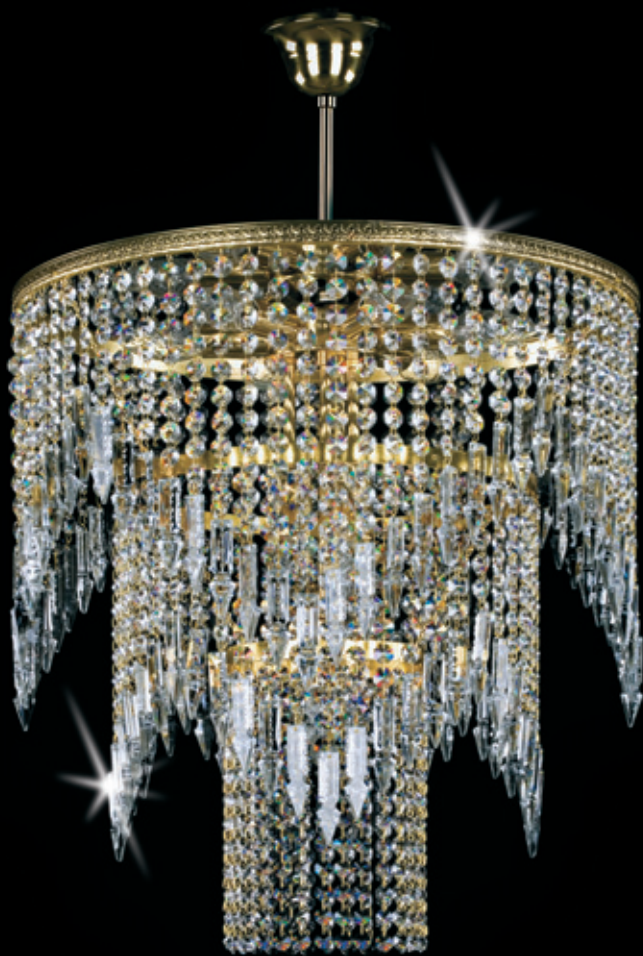
BRENDA 500x570 mm 10x40 W