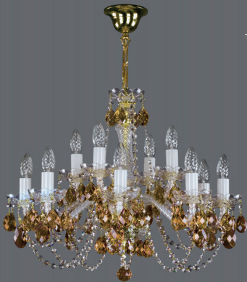
CARMEN colour 620x480 mm 12x40 W