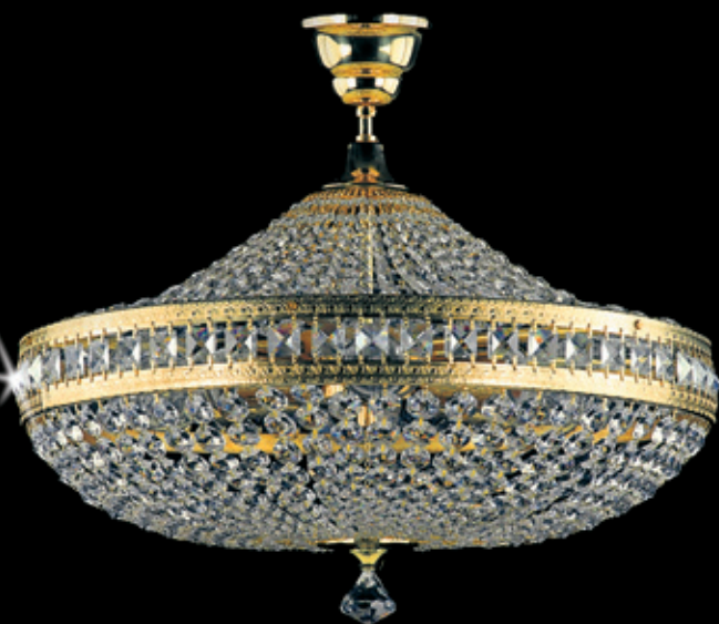
VALERIE II. 500x450 mm 6x60 W