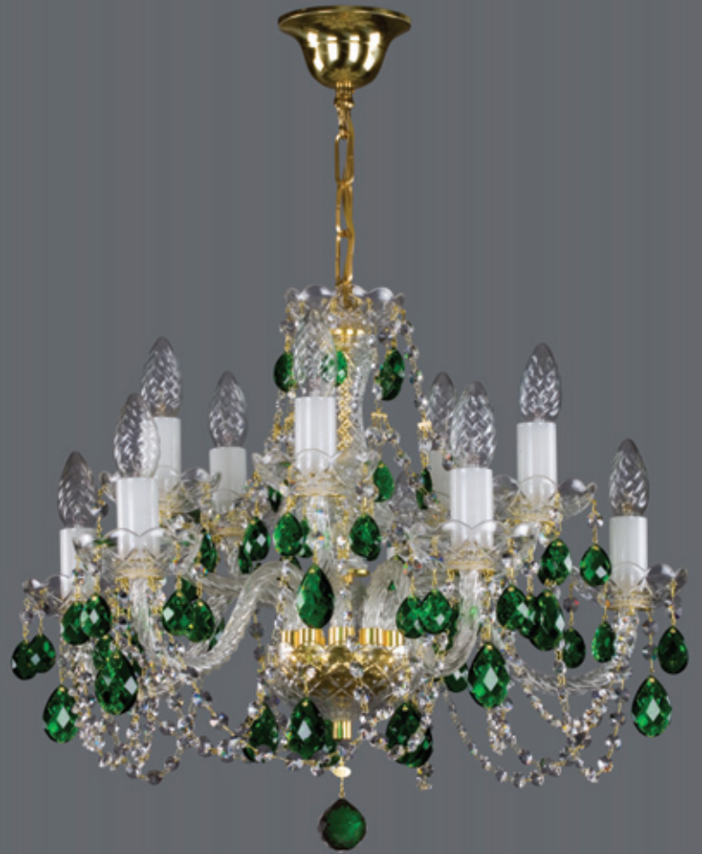
RADKA X. colour 600x450 mm 10x40 W