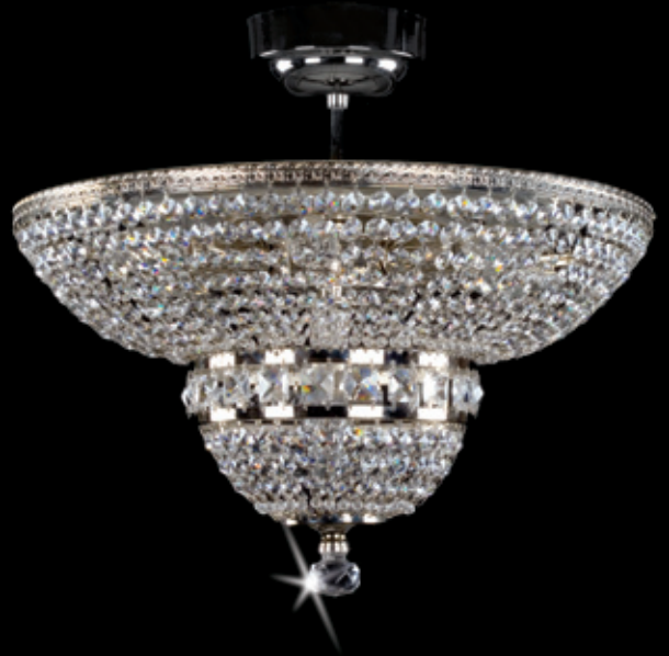
MARIE nickel 450x400 mm 7x40 W