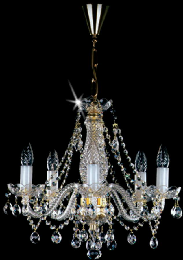
MAGDA 480x420 mm 5x40 W