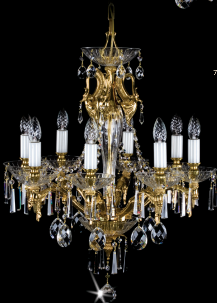
LILIE 600x650 mm 8x40 W