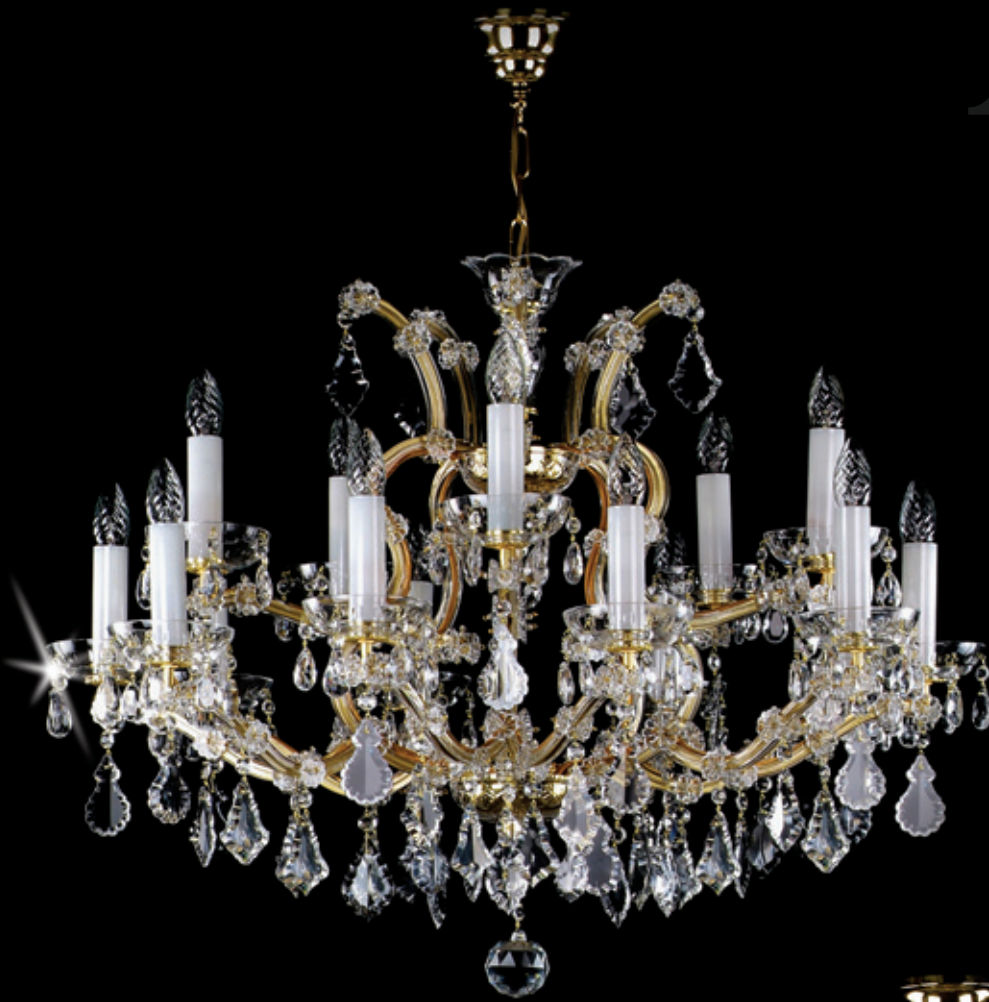
MARIA TEREZIA 14 750x680 mm 15x40 W