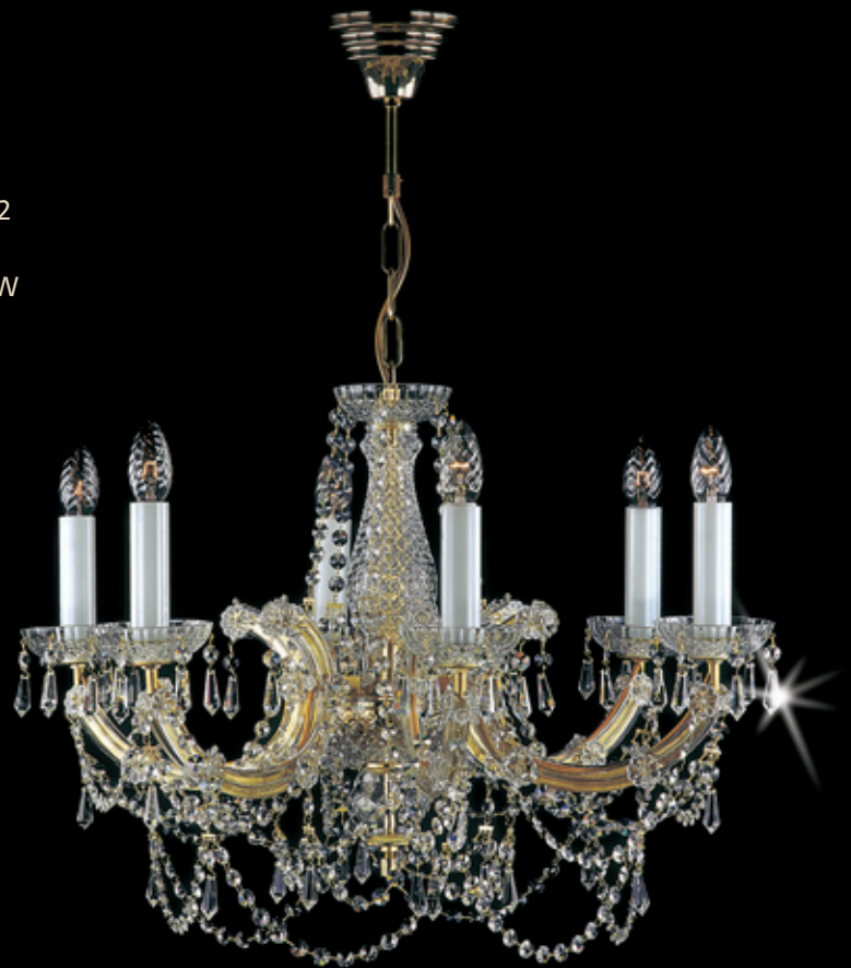
MARIA TEREZIA 2 550x460 mm 6x40 W