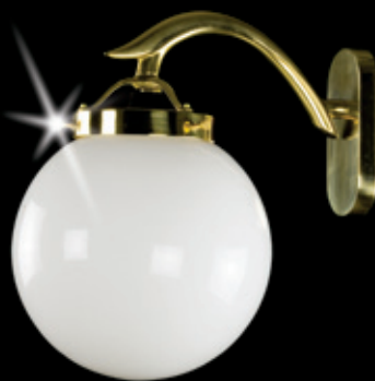
SALOME WL 200x290 mm 1x60 W