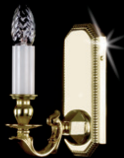
GRACIE I. WL 75x200 mm 1x40 W