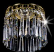
SPOT 02 120x100 mm 1x35 W