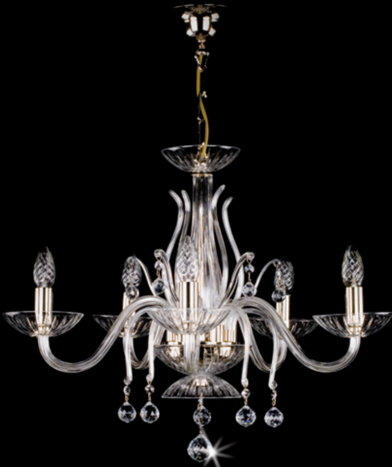
ELEKTRA V. nickel 600x490 mm 5x40 W