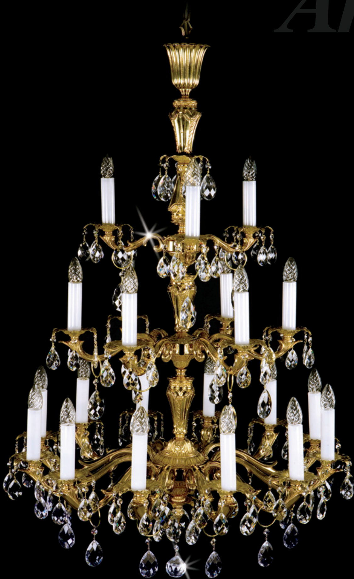
HERMIONA 820x1250 mm 21x40 W