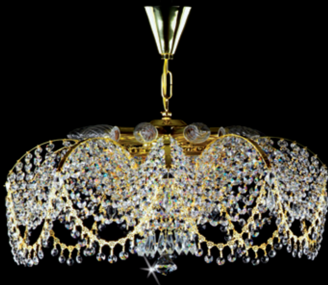
PAVLA II. 500x350 mm 9x40 W