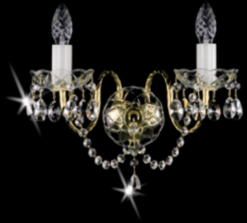
VARVARA II. WL 340x320 mm 2x40 W