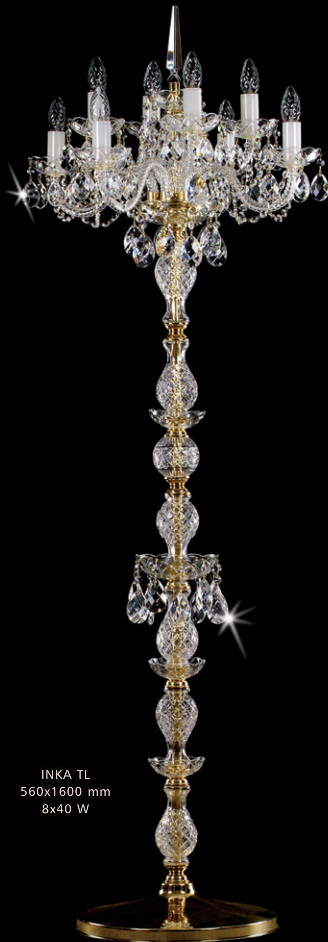
INKA TL 560x1600 mm 8x40 W