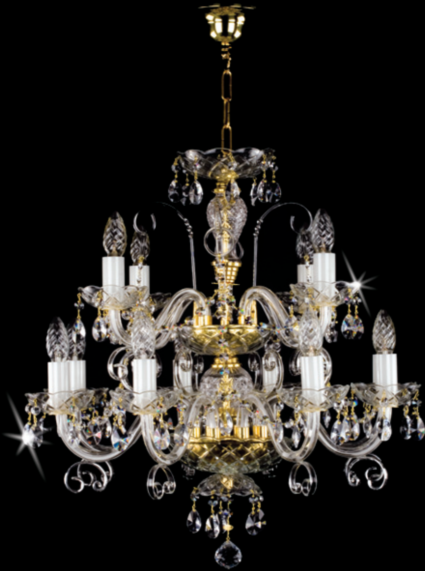
ELIZABETHA XII. 620x620 mm 12x40 W