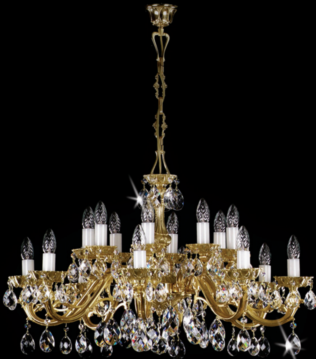
VIKTORIE 810x440 mm 16x40 W