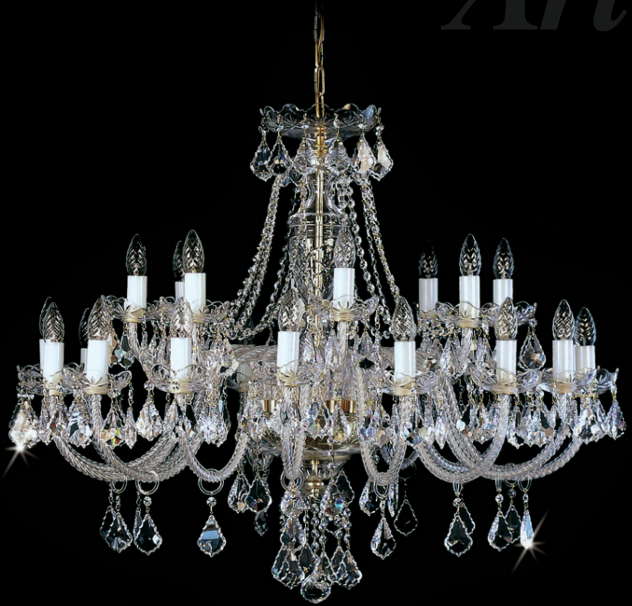
SARA XXIV. 1000x800 mm 24x40 W