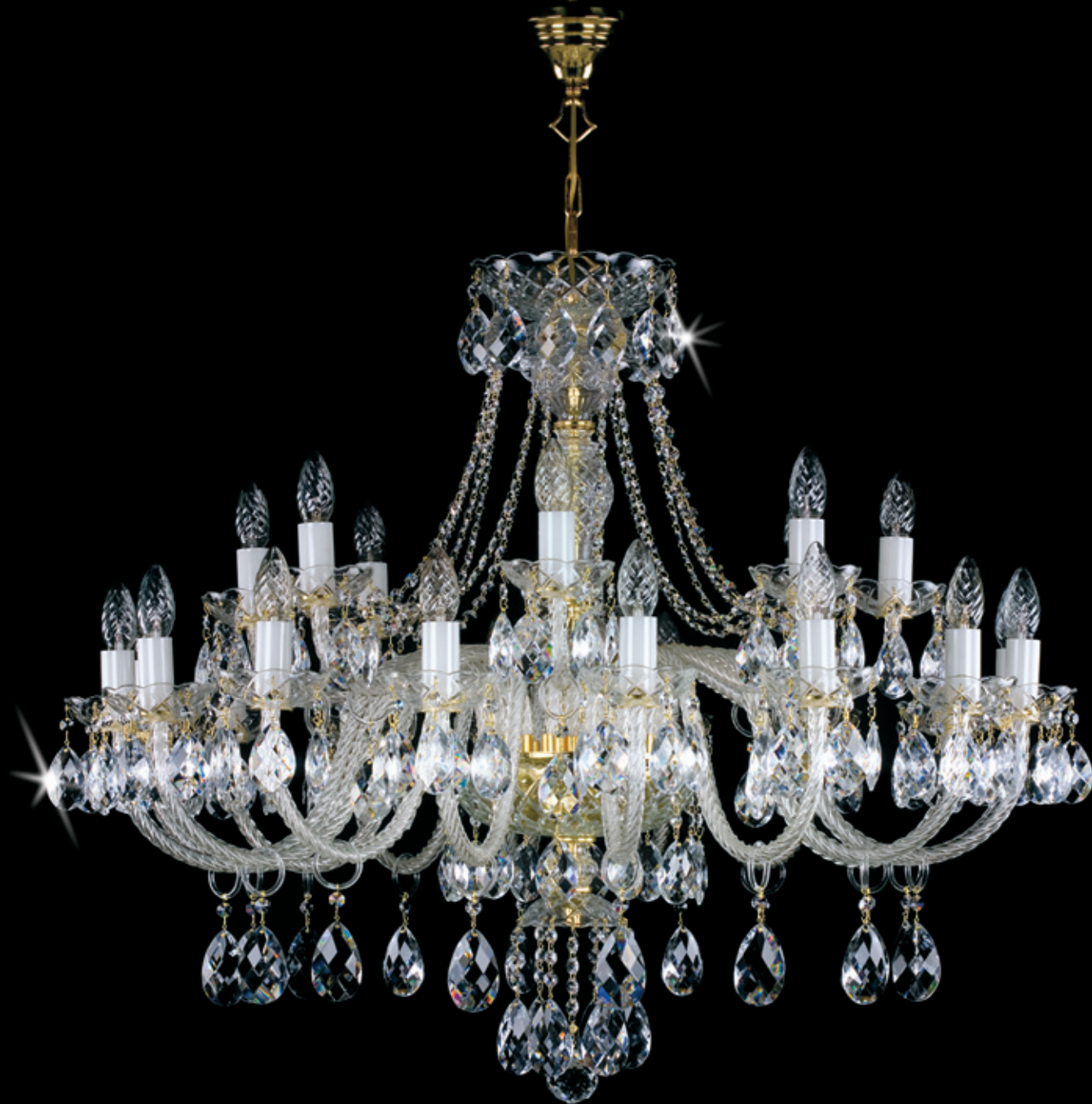
NANCY XXIV. 1000x800 mm 24x40 W