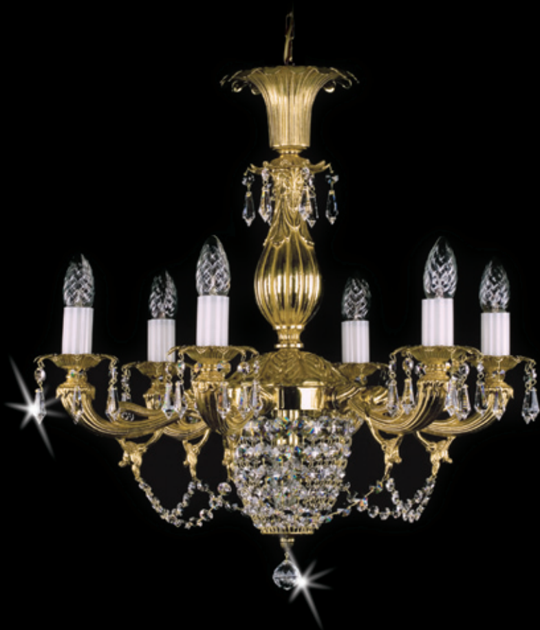
JORGA 570x570 mm 7x40 W