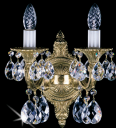
ŠÁRKA II. WL 260x350 mm 2x40 W