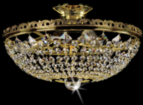
NORMA I. NORMA I. + mirror 350x150 mm 3x40 W