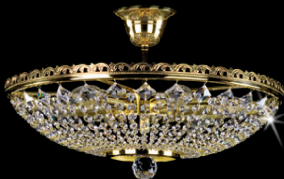
NORMA II. NORMA II. + mirror 450x160 mm 6x40 W